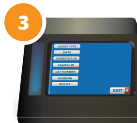
Lea Resultados en Menos de 5 Segundos