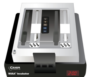
Para Procesar varias Muestras

Incube múltiples tiras simultáneamente, lea resultados en el sistema Charm EZ.